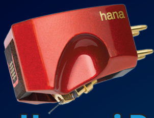
Hana Umami Red