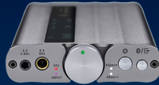
iFI Audio xDSD